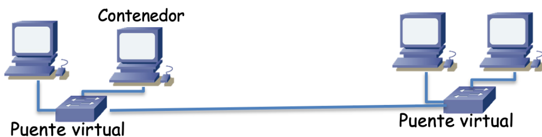
Figura 2 - Red virtual

Ahora configure la dirección IP del interfaz de cada contenedor de forma que estén en la misma subred aunque estén en hosts diferentes. Con eso ya deberían alcanzarse el uno al otro sin saltos IP enrutados aparentes y las tramas Ethernet se transportarán sobre GRE si las miramos con tcpdump en el interfaz de uno de los hosts. La red virtual es simplemente la que se muestra en la Figura 2.