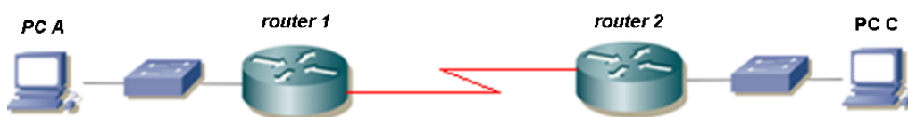
Figura 1.- Topología en serie